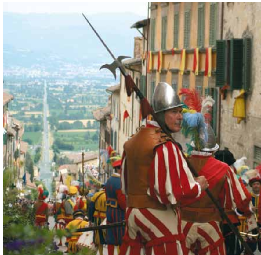
Anghiari, 29 Giugno, Palio della Vittoria