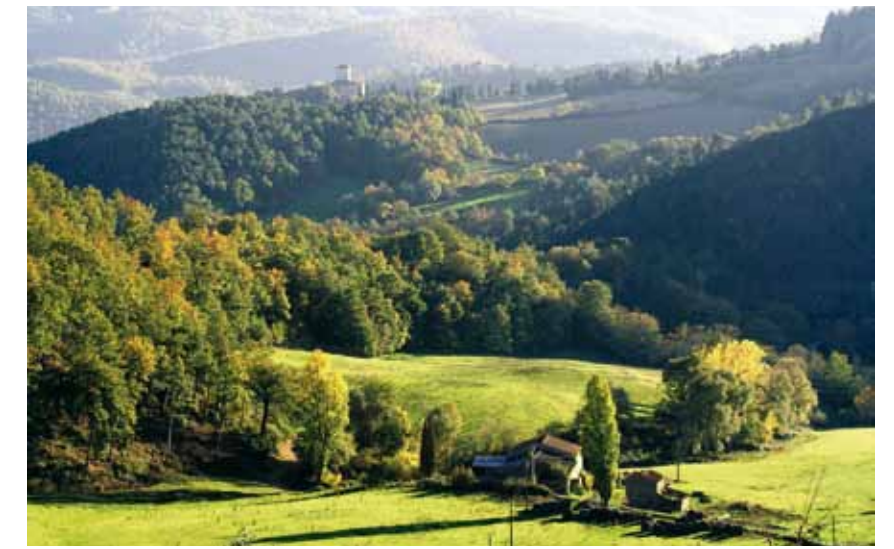
Anghiari, ai limiti della Riserva Naturale dei Monti Rognosi

Probably of Etruscan origin, this small mountain centre huddles around the Romanesque church of San Pancrazio. The Antiquarium Nazionale museum preserves the archaeological remains attesting to the town's ancient origin.